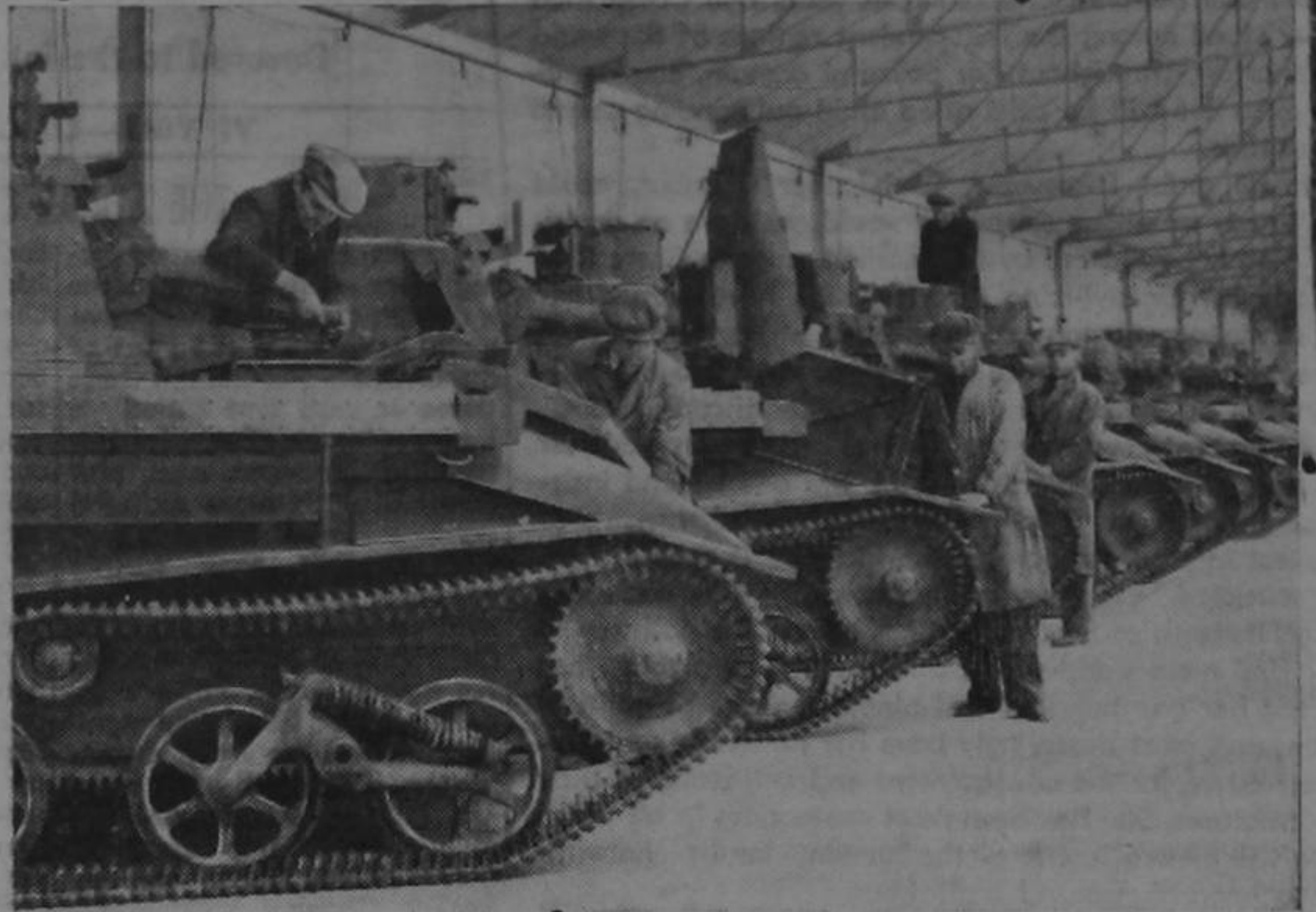
Tanks as far as the eye can see in a British ordnance depot. And still more tanks in ever increasing numbers pour from Britain's factories, for the British Empire's mighty resources are marshalled with one object—to out arm and out—fight German terror.

—Por qué los borrachos ven las cosas dobles? —Porque el nombre ya lo dice: beo-dos.