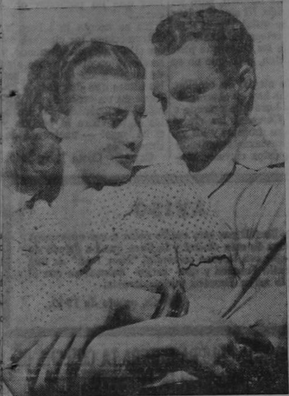
JAMES CAGNEY y ANN SHERIDAN, se aman de verdad en la película "ZONA TORRIDA" de la Warner Bros.

INTERESANTE ERA EL CONTRASTE QUE HACIAN JAMES CAGNEY Y PAT O'BRIEN EN LA PELICULA TITULADA: "ANGELES CON CARAS SUCIAS" ("ANGELS IN DIRTY FACES") QUE MUY PRONTO SE FIJARON EN LA INTENSIDAD QUE SHERIDAN PRESTO TAMBIEN A AQUELLA OBRA... LUEGO VINO "ZORRA TORRIDA" ("TORRID ZONE") Y YA NADIE PUDO HACERSE SORDO A LO QUE ES COMBINACION DE ARTISTAS SIGNIFICA PARA EL EMOCIONALISMO DE UN MELODRAMA DE ACCION BRUTAL COMO ESTE DE QUE TRATAMOS